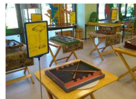
Тематическая программа «Пионерская игротека»