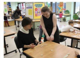
Старинная игра «Блошки»