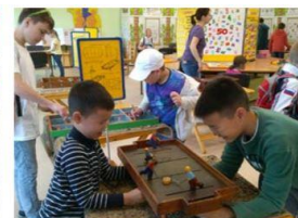
Старые игры не стареют и остаются интересными для современных детей