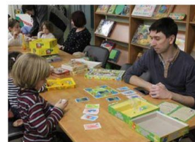
В настольные игры можно играть с родителями