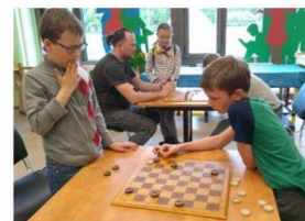
Турнир по игре «Шахматы»