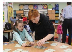
Игра Мемори по сказкам Пушкина в макси варианте